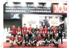
北京エッセン in 東莞