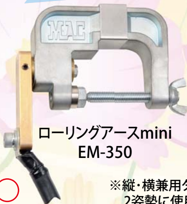
ローリングアースmini EM-350

期間中、パイプローラー『PR-200II』をご購入で ローリングアースmini『EM-350』を1つサービス!