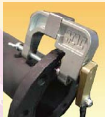
フランジ用取付例