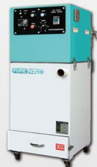
ヒュームゼロ FZ-2010 (吸引風速調整可能)

局所排気装置とは、ヒュームの発散源に吸引フードを設ける装置です。ヒュームの発散源の近くで吸引するため、周囲に汚染が広がらないうちに除去でき、集じん効率もたいへん高いことから、もっとも有効な方法である。但し、アーク近傍では強い風速の影響を受けて溶接欠陥(ブローホール)を生じる場合があるので、吸引風速を調整できる排気装置であることがポイントとなる。