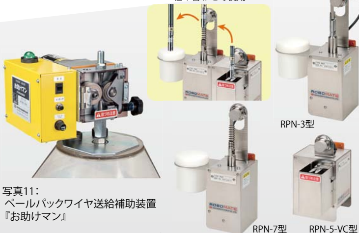
写真11: パールパックワイヤ送給補助装置 『お助けマン』